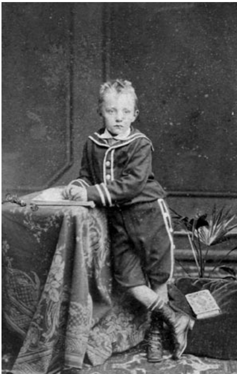
▲ Paul Otlet petit garçon. Dès son plus jeune âge, il se fait photographier avec un livre à la main. Il conservera cette habitude toute sa vie.