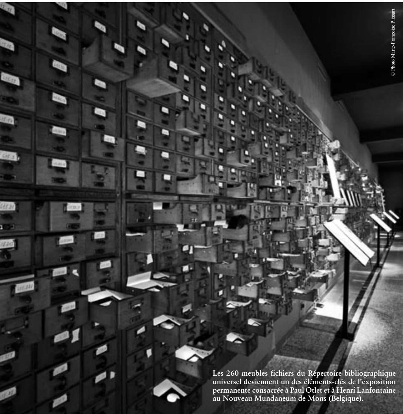
Les 260 meubles fichiers du Répertoire bibliographique universel deviennent un des éléments-clés de l'exposition permanente consacrée à Paul Otlet et à Henri Lanfontaine au Nouveau Mundaneum de Mons (Belgique).